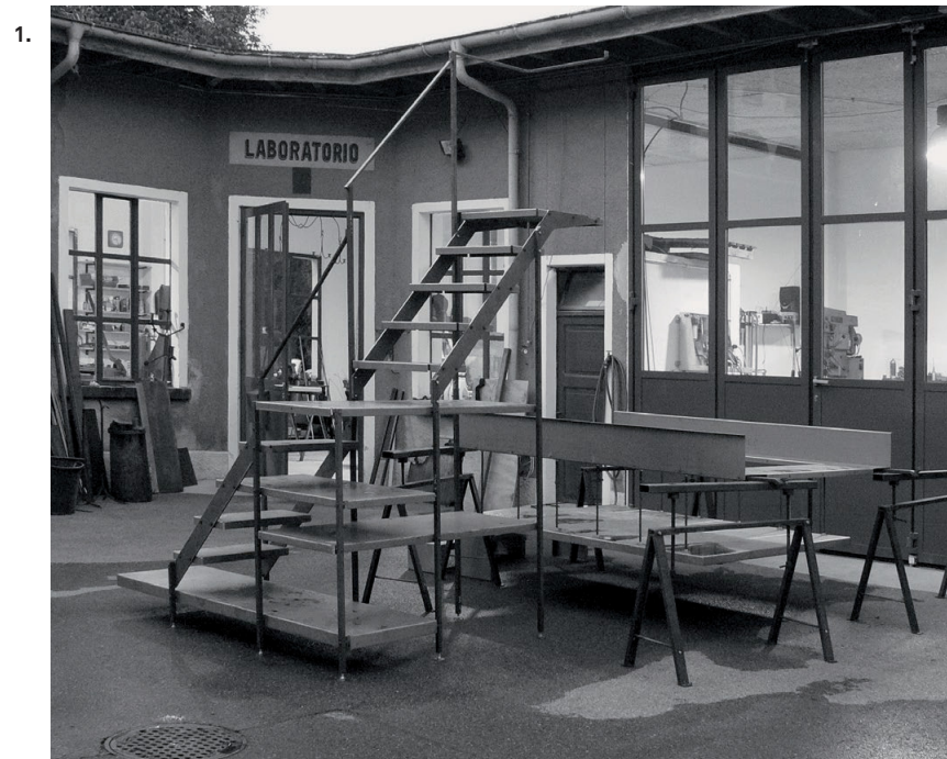
1. Il laboratorio di via Vela a Bellinzona. In primo piano il soppalco Fernando in fase di premontaggio

Dal mio punto di vista, il meccanico costruisce degli ingranaggi e mette insieme dei meccanismi. L'introduzione generalizzata della saldatura ha invece contribuito a banalizzare il concetto dell'assemblaggio – che per me rimane fondamentale –, facendo diventare